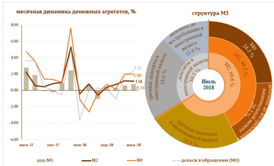
Диаграмма 1. Денежный агрегат M3

Сальдо депозитов в национальной валюте увеличилось на 173.6 млн. леев и составило 35711.6 млн. леев, составив долю 60.1% от общего сальдо депозитов, а депозитов в иностранной валюте (пересчитанное в леях) снизилось на 23.9 млн. леев, до уровня 23722.2 млн. леев, с долей 39.9% (диаграмма № 2).