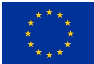
Прямой эфир на английском языке: