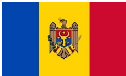
Прямой эфир на румынском языке:

Мероприятие по запуску проекта Twinning: «Усиление надзора, корпоративного управления и управления рисками в финансовом секторе Республики Молдова»