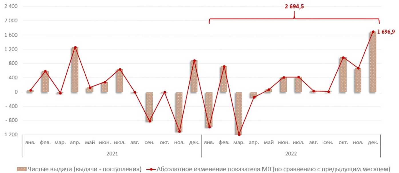
Диаграмма № 1. Взаимосвязь показателя M0 с объемом кассовых операций, млн леев

В 2022 году, объем денежных поступлений увеличился на 12,0% по сравнению с предыдущим годом и составил 171 865,6 млн леев. Увеличение объема поступлений наличных денежных средств обусловлено, в основном, увеличением на 8,4% поступлений от реализации потребительских товаров (независимо от каналов их реализации), которые имеют наибольшую долю (54,0%) в совокупном объеме поступлений (Диаграмма № 2). Значительные поступления были от пополнения текущих счетов и депозитных счетов физических лиц (18 067,6 млн леев), а также от предприятий, оказывающих другие услуги (13 004,6 млн леев).