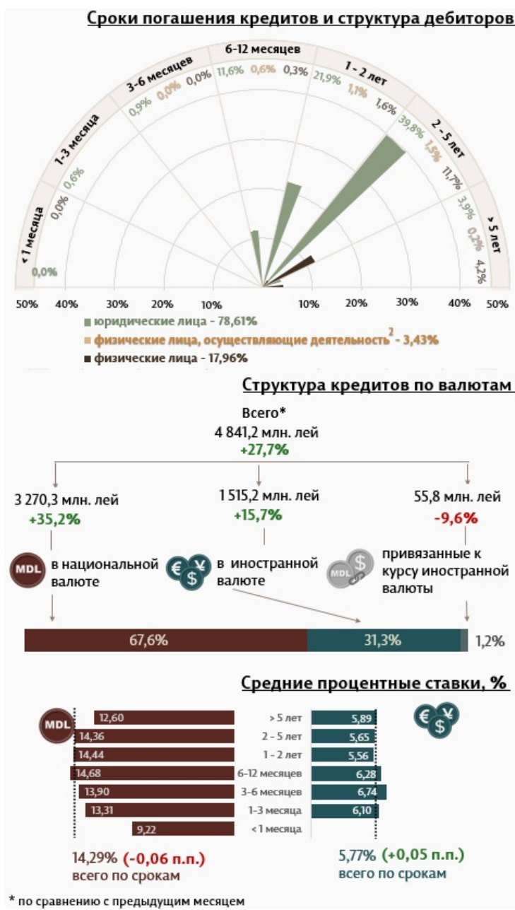
Инфографика 1. Динамика вновь выданных кредитов

В марте 2023 вновь выданные кредиты 1 (Инфографика 1) составили 4 841,2 миллиона леев, на 27,7% выше по сравнению с февралем 2023 года. Основную часть (67,6%) составляют кредиты в национальной валюте, которые составили 3 270,3 миллиона леев, что выше на 35,2% по сравнению с предыдущим месяцем.