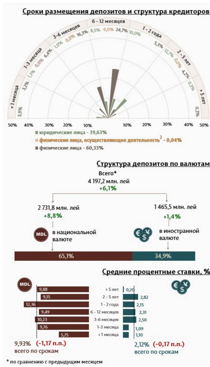
Инфографика 1. Динамика вновь выданных депозитов

Средняя номинальная ставка по новым депозитам, привлеченным в национальной валюте, снизилась на 1,17 процентных пункта по сравнению с предыдущим месяцем и составила 9,93%. Средняя номинальная ставка по депозитам в иностранной валюте снизилась на 0,17 процентных пункта, составив 2,12%.