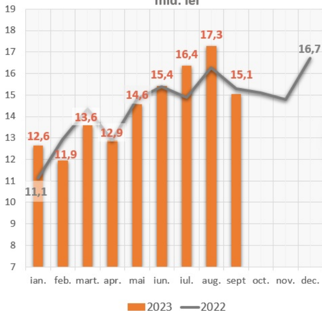
Dinamica lunară a eliberărilor banilor în numerar, mld. lei