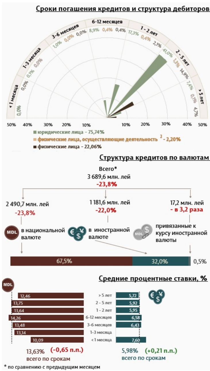
Инфографика 1. Динамика вновь выданных кредитов

В апреле 2023 вновь выданные кредиты 1 (Инфографика 1) составили 3 689,6 миллиона леев, на 23,8% ниже марта 2022 г. Основную часть (67,5%) составляют кредиты в национальной валюте, которые составили 2 490,7 миллиона леев, на 23,8% ниже по сравнению с предыдущим месяцем.