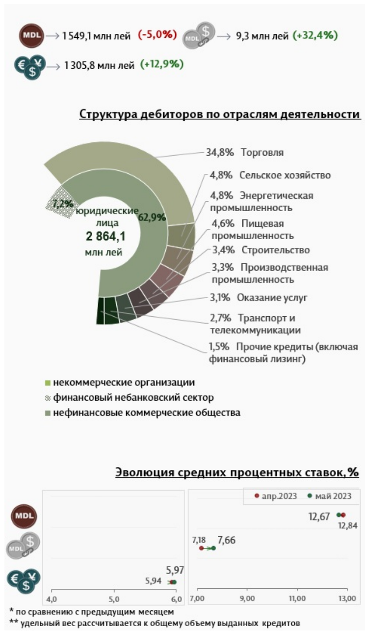
Инфографика 3. Вновь выданные кредиты юридическим лицам.

По сравнению с предыдущим месяцем, в отчетном периоде юридические лица востребовали меньше кредитов в национальной валюте (-5,0%). В то же время вырос объем кредитов в иностранной валюте (+12,9%) и привязанных к курсу валюты 3 (+32,4%). Средняя ставка по кредитам, выданным юридическим лицам в национальной валюте, снизилась на 0,17 процентных пункта, до уровня 12,67% (инфографика 3). В то же время средняя ставка по кредитам, выданным в иностранной валюте, увеличилась на 0,03 процентных пункта и составила 5,97%.