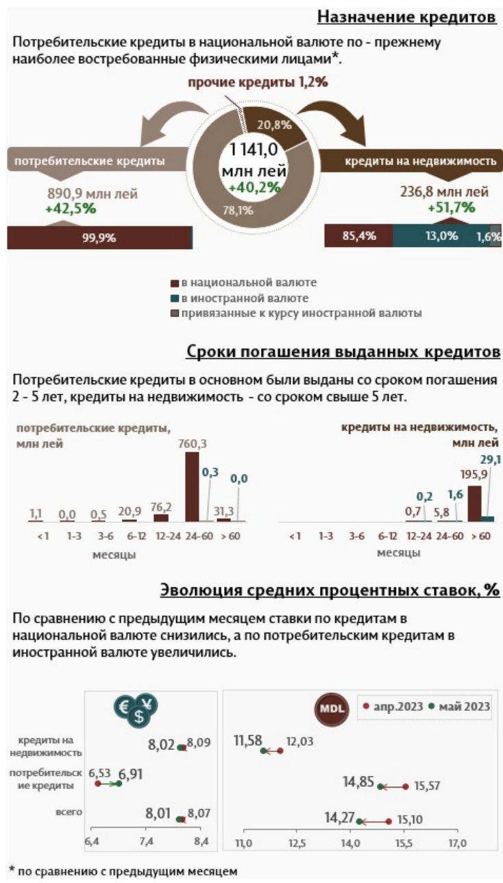
Инфографика 2. Вновь выданные кредиты физическим лицам.

Кредиты на недвижимость составляют 20,8% от всех кредитов, выданных физическим лицам, и были предоставлены в основном в национальной валюте (85,4% от общего объема кредитов на недвижимость).