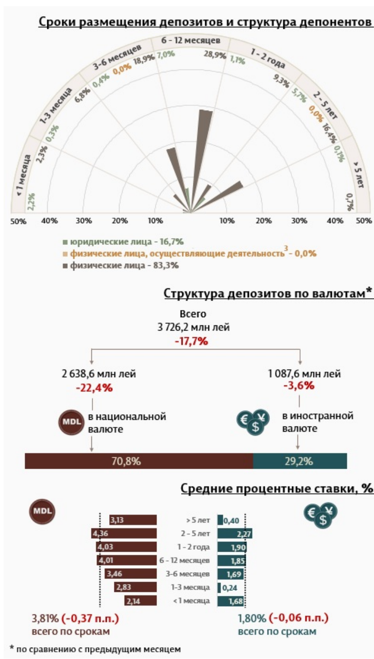
Инфографика 1. Динамика вновь привлеченных депозитов 2

В феврале 2024 г. вновь привлеченные срочные депозиты 1 (Инфографика 1) составили 3 726,2 миллиона леев, на 17,7% ниже января 2024 года. Привлеченные депозиты в национальной валюте составили наибольшую долю в 70,8% или 2 638,6 миллиона леев, что на 22,4% ниже по сравнению с предыдущим месяцем. Депозиты, привлеченные в иностранной валюте, составили 1 087,6 млн леев, снизившись на 3,6% по сравнению с предыдущим месяцем.