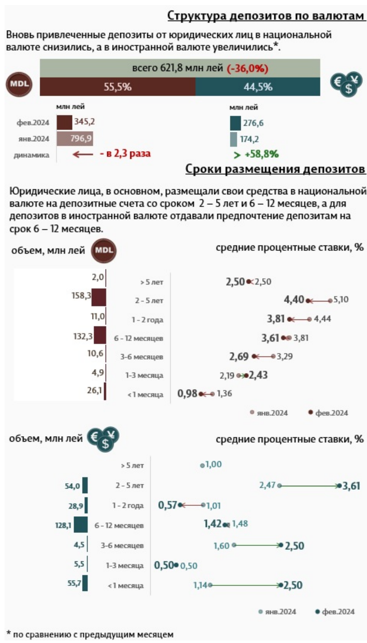
Инфографика 3. Вновь привлеченные срочные депозиты от юридических лиц

юридических лиц в национальной валюте составили 345,2 миллиона леев, а в иностранной валюте – 276,6 миллиона леев.