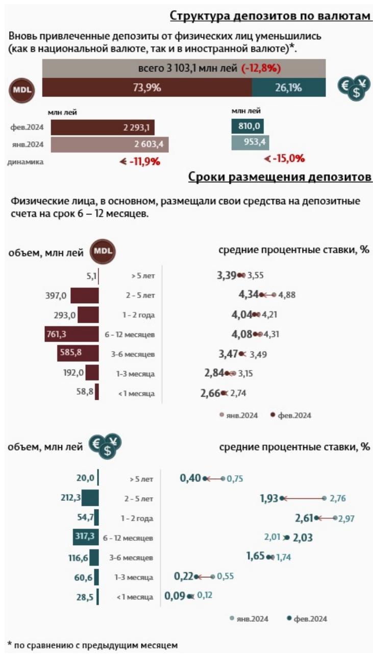
Инфографика 2. Вновь привлеченные срочные депозиты от физических лиц

Самыми привлекательными, с точки зрения сроков размещения депозитов, были депозиты со сроком от 6 до 12 месяцев, доля которых составила 35,9%, и депозиты сроком от 2 до 5 лет - с долей 22,1% от всего привлеченных срочных депозитов.