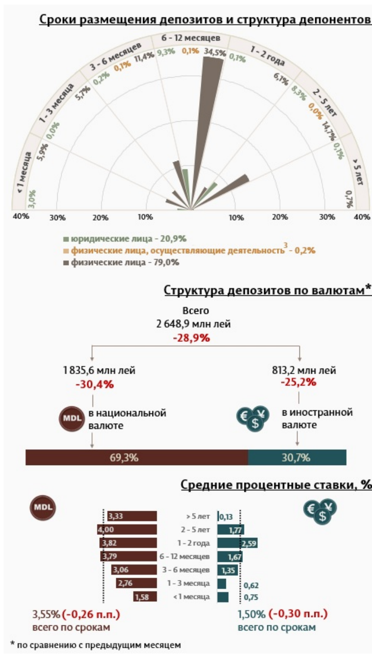
Инфографика 1. Динамика вновь привлеченных депозитов 2

В марте 2024 г. вновь привлеченные срочные депозиты 1 (Инфографика 1) составили 2 648,9 миллиона леев, на 28,9% ниже февраля 2024 года. Привлеченные депозиты в национальной валюте составили наибольшую долю в 69,3% или 1 835,6 миллиона леев, что на 30,4% ниже по сравнению с предыдущим месяцем. Депозиты, привлеченные в иностранной валюте, составили 813,2 млн леев, снизившись на 25,2% по сравнению с предыдущим месяцем.