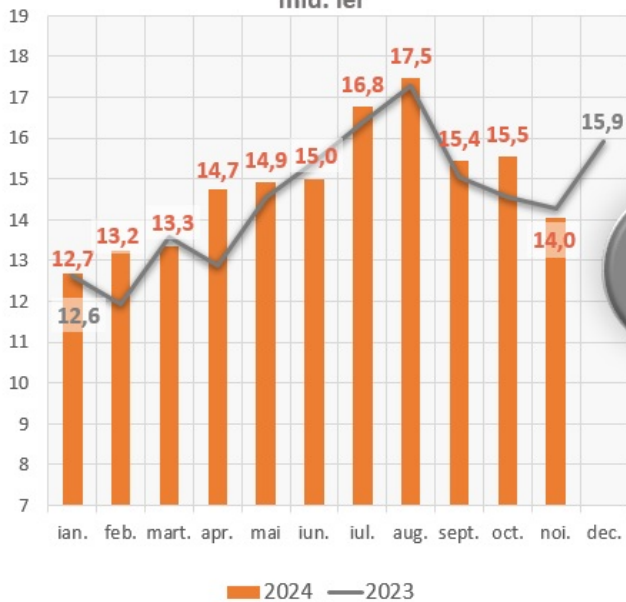
Scopurile eliberărilor, cumulativ ianuarie - noiembrie 2024, mld. lei