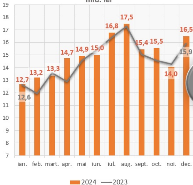
Dinamica lunară a eliberărilor banilor în numerar, mld. lei