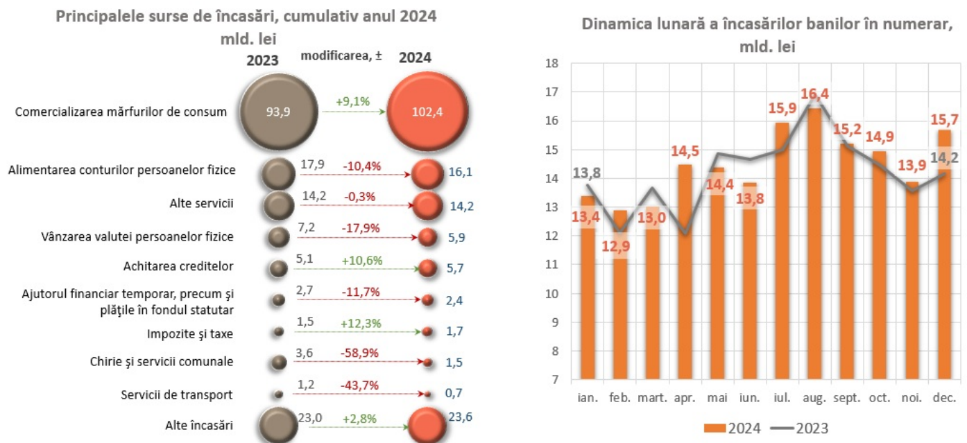
Diagrama nr. 1. Principalele surse de încasări de numerar și dinamica lunară a acestora 4

Totodată, au fost înregistrate diminuări considerabile la încasările din chirii și servicii comunale cu 2 092,6 mil. lei (-58,9 la sută), la încasările pe conturile curente și conturile de depozit ale persoanelor fizice cu 1 861,2 mil. lei (-10,4 la sută), precum și la încasările din vânzarea valutei persoanelor fizice cu 1 293,5 mil. lei (-17,9 la sută), însumând 5 938,1 mil. lei (echivalentul a 333,8 mil. USD 3 ).