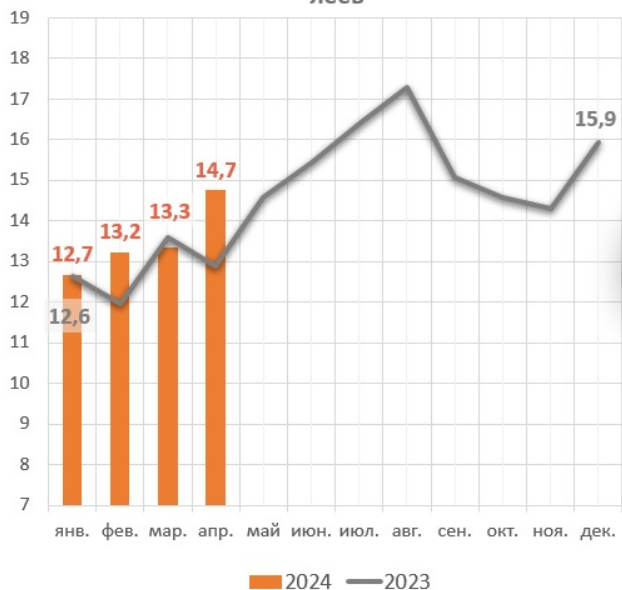
Помесячная динамика выдач денежных средств, млрд леев