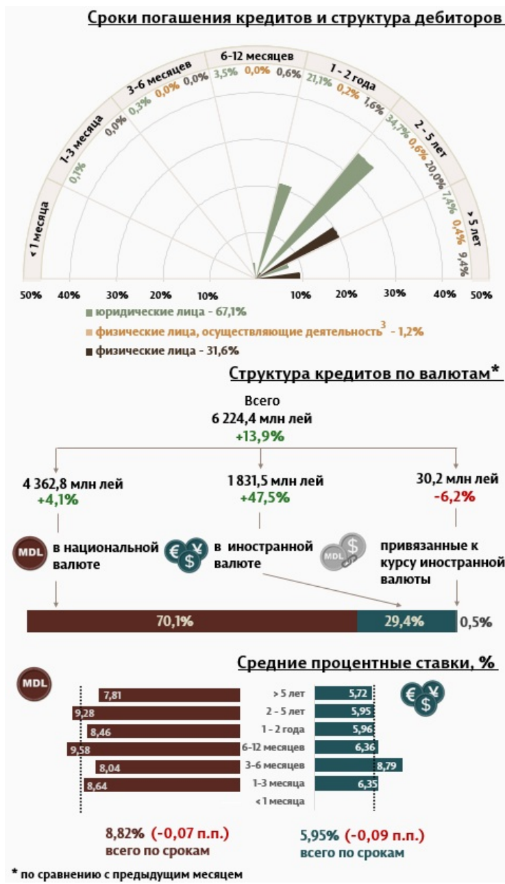
Инфографика 1. Динамика вновь выданных кредитов 2

С точки зрения сроков выданных кредитов, наибольшим спросом пользовались кредиты на срок от 2 до 5 лет, доля которых составила 55,3% от общего объема выданных кредитов. Объем данных кредитов, выданных юридическим лицам, составил 34,7% от общего объема кредитов.