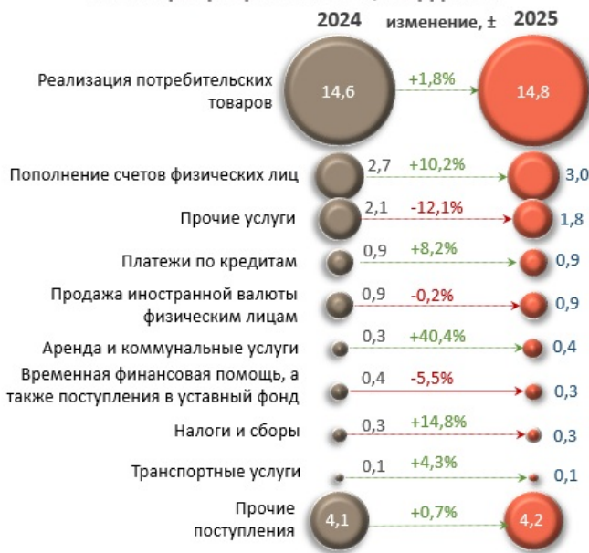
Помесячная динамика денежных поступлений, млрд леев