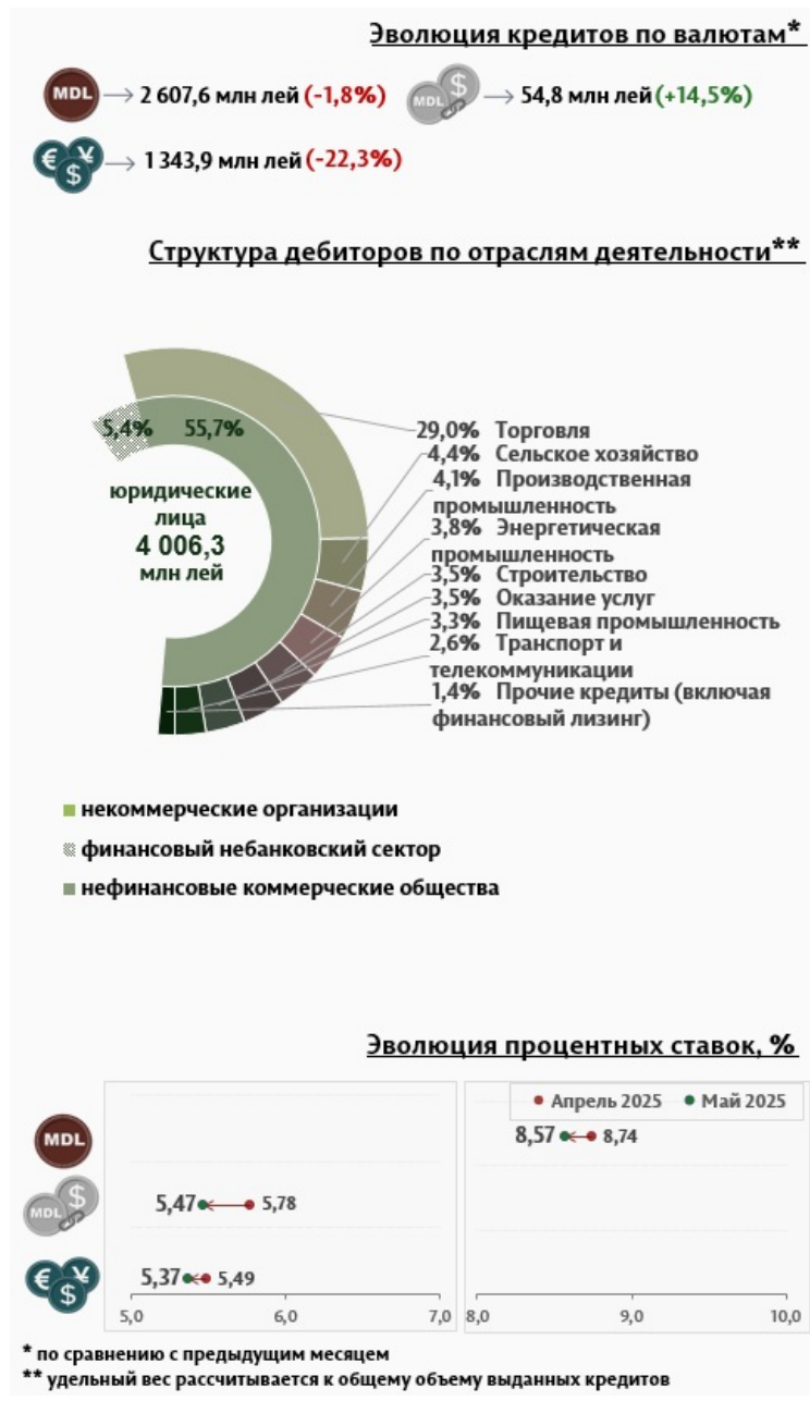
Инфографика 3. Вновь выданные кредиты юридическим лицам

Средняя ставка по кредитам, выданным юридическим лицам в национальной валюте, снизилась на 0,17 п. п., до уровня 8,57%. В то же время средняя ставка по кредитам, выданным в иностранной валюте, снизилась на 0,12 п. п. и составила 5,37%.