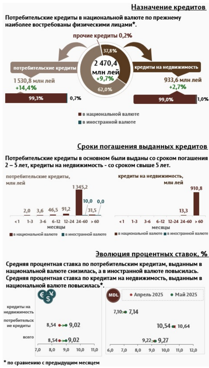
Инфографика 2. Вновь выданные кредиты физическим лицам

Кредиты на недвижимость были выданы в основном в национальной валюте и составляют 37,8% от общего объёма кредитов, выданных физическим лицам.