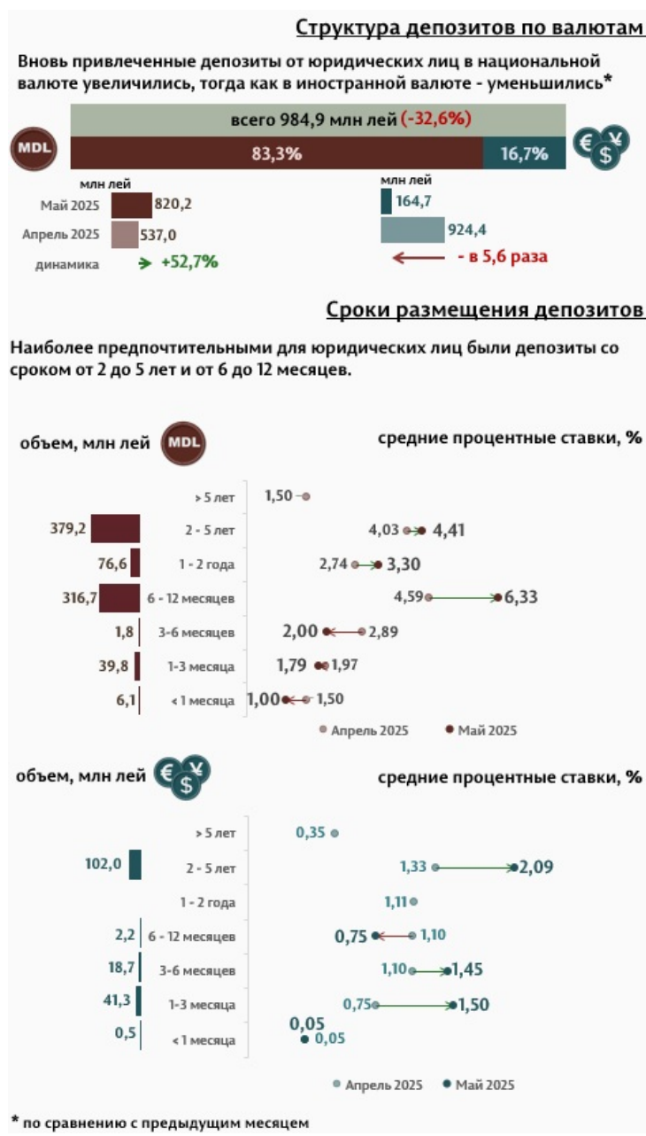
Инфографика 3. Вновь привлечённые срочные депозиты от юридических лиц

Средняя ставка по депозитам, привлечённым в национальной валюте от юридических лиц повысилась по сравнению с предыдущим месяцем на 1,24 п. п. до уровня 4,89%, в то время как средняя ставка по депозитам, привлечённым в иностранной валюте, повысилась на 0,55 п. п. и составила 1,85%.