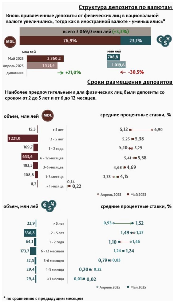
Инфографика 2. Вновь привлечённые срочные депозиты от физических лиц

В отчётном месяце депозиты физических лиц составили 3 069,0 миллиона леев, увеличившись на 3,3% по сравнению с предыдущим месяцем (Инфографика 2). Наиболее востребованными были депозиты со сроком от 2 до 5 лет и депозиты со сроком от 6 до 12 месяцев, составившие соответственно 50,8% и 27,0% от общего объёма депозитов физических лиц. По сравнению с маем 2024 г., объём вновь привлечённых депозитов от физических лиц в национальной валюте увеличился на 76,2%, тогда как в иностранной валюте – уменьшился на 4,2%.