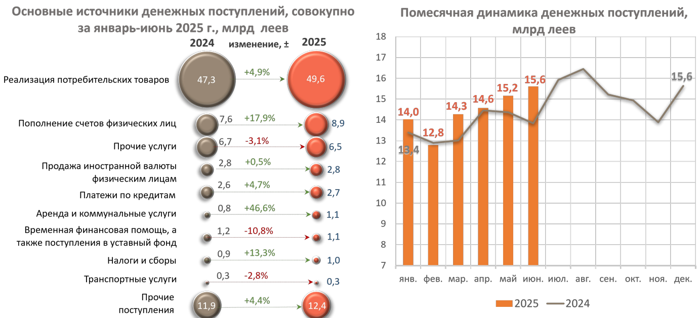
Диаграмма № 1. Основные источники поступлений денежной наличности в кассах банков и их месячная динамика 2

При этом поступления от предприятий, оказывающих прочие услуги, сократились на 205,5 млн леев (-3,1%).