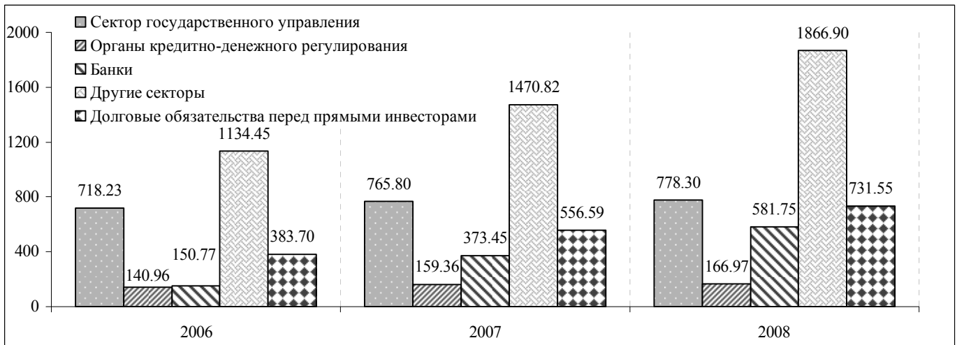
График 2. Внешний долг по срокам погашения (млн. долларов США)