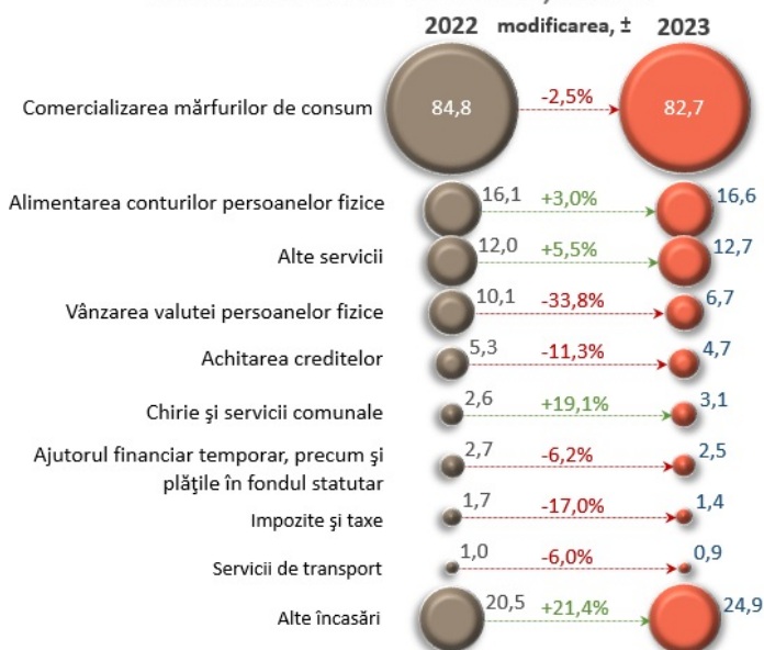
Principalele surse de încasări, cumulativ ianuarie – noiembrie, mld. lei