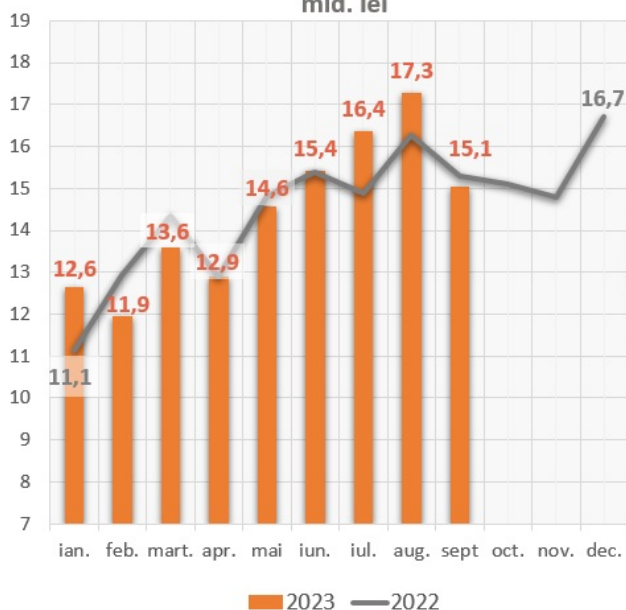
Dinamica lunară a eliberărilor banilor în numerar, mld. lei