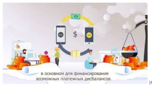
De ce o țară are nevoie de rezerve valutare [8]