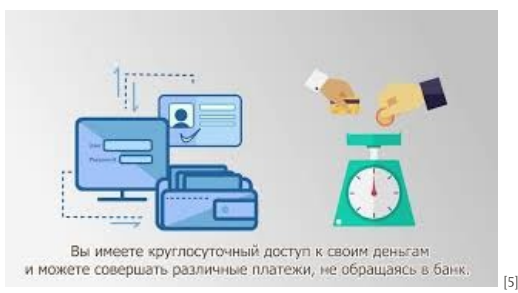
Cum să utilizăm cardul de plată în siguranță [5]