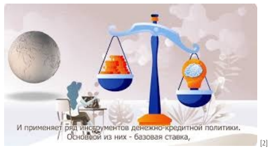
De ce se iau deciziile de politică monetară [2]