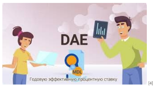
La ce să fim atenți când luăm un credit [4]