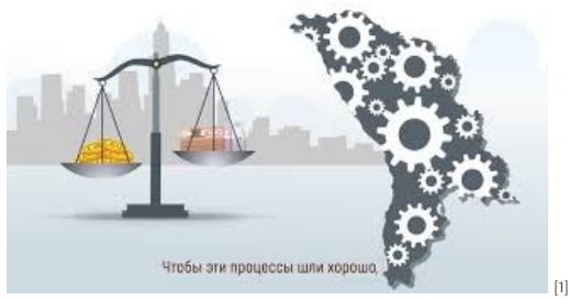
Rolul Băncii Naționale a Moldovei [1]