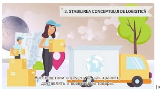
Cum inițiezi o afacere în mediul online [10]