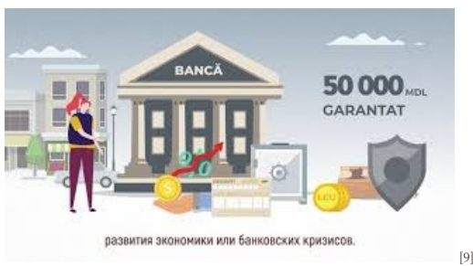
Care este diferența dintre sectorul bancar și cel nebancar [9]