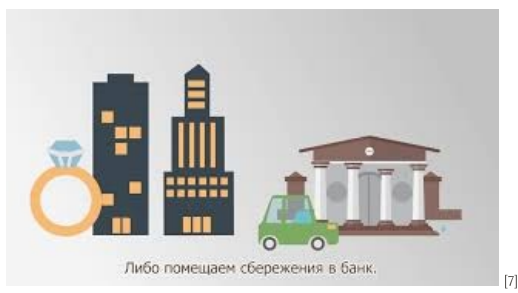
De la economii la investiții [7]