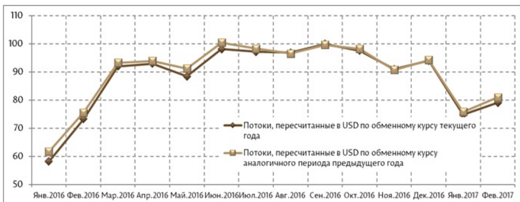
Денежные переводы из-за границы, осуществленные в пользу физических лиц, в месячной динамике, декабрь 2016 г. - февраль 2017гг., влияние обменного курса (млн. долларов США)

В феврале 2017 колебания обменных курсов оригинальных валют по отношению к доллару США способствовали снижению переводов на 2.6 процентных пункта, при фактическом их увеличении на 10.4 процентных пункта (исключая влияние обменного курса с помощью пересчета переводов по обменному курсу соответствующего периода предыдущего года).