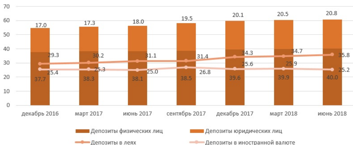
Депозиты банковского сектора, млрд.леев

леев (4.6%), составив 35.8 миллиарда леев на 30.06.2018. Депозиты в валюте составили 41.3% в общем объеме депозитов, их сальдо уменьшилось в течение полугодия на 460.9 млн. леев (1.8%), составив 25.2 миллиарда леев.