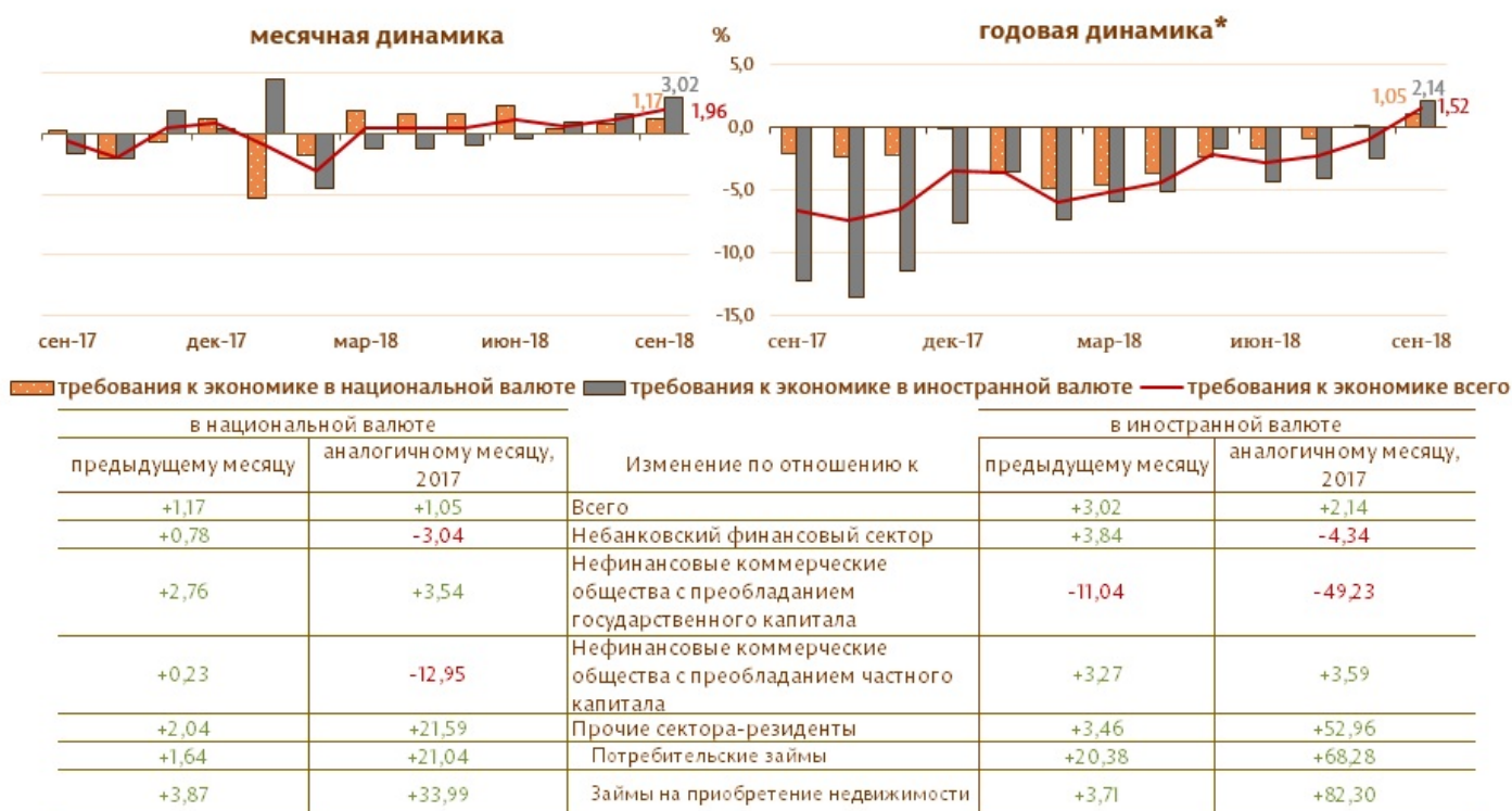
Диаграмма 3. Динамика требований к экономике

Сальдо требований к экономике 9 выросло в отчетном периоде на 748.3 млн. леев (2.0%) за счет увеличения требований к экономике в национальной валюте на 257.2 млн. леев (1.2%), а также требований в иностранной валюте (выраженных в молдавских леях) на 491.1 млн. леев или на 3.0% (диаграмма 3).