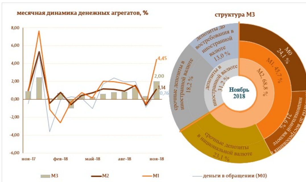
Диаграмма 1. Денежный агрегат M3

Следует отметить, что денежные агрегаты Деньги в обращении (M0) и Денежная масса (M1) 5 выросли по отношению к ноябрю 2017 года на 8,9 и 16,3%, соответственно.