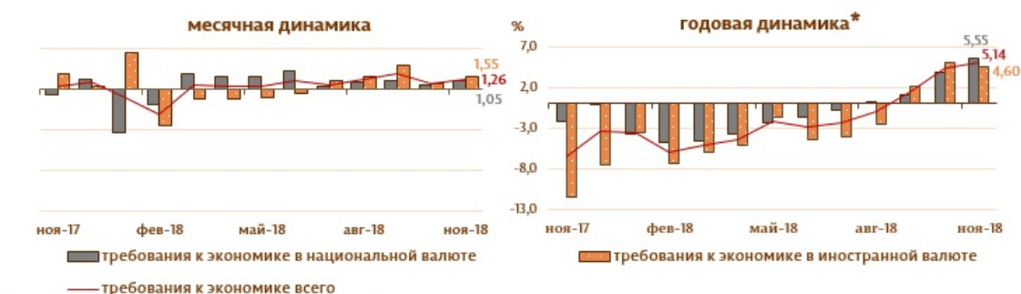
Диаграмма 3. Динамика требований к экономике

Сальдо требований к экономике 9 выросло в отчетном периоде на 494,7 млн. леев (1,3%) за счет увеличения требований к экономике в национальной валюте на 233,8 млн. леев (1,1%), а также требований в валюте (выраженных в леях) на 260,9 млн. леев, или на 1,6% (диаграмма 3).