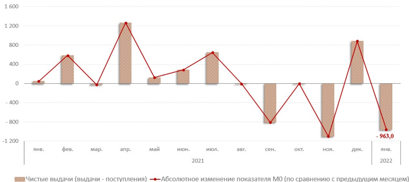
Диаграмма № 1. Взаимосвязь показателя M0 с объемом кассовых операций по банковской системе, млн. леев

В январе 2022 г. объем денежных поступлений увеличился на 24,5% по сравнению с аналогичным периодом прошлого года и составил 12 099,6 млн. леев. Увеличение объема денежных поступлений в основном обусловлено увеличением на 18,1% поступлений от реализации потребительских товаров (независимо от каналов их реализации), которые имеют наибольшую долю (52,3%) в объеме общих поступлений (Диаграмма №2). Данная эволюция была подкреплена увеличением практически всех источников денежных поступлений.