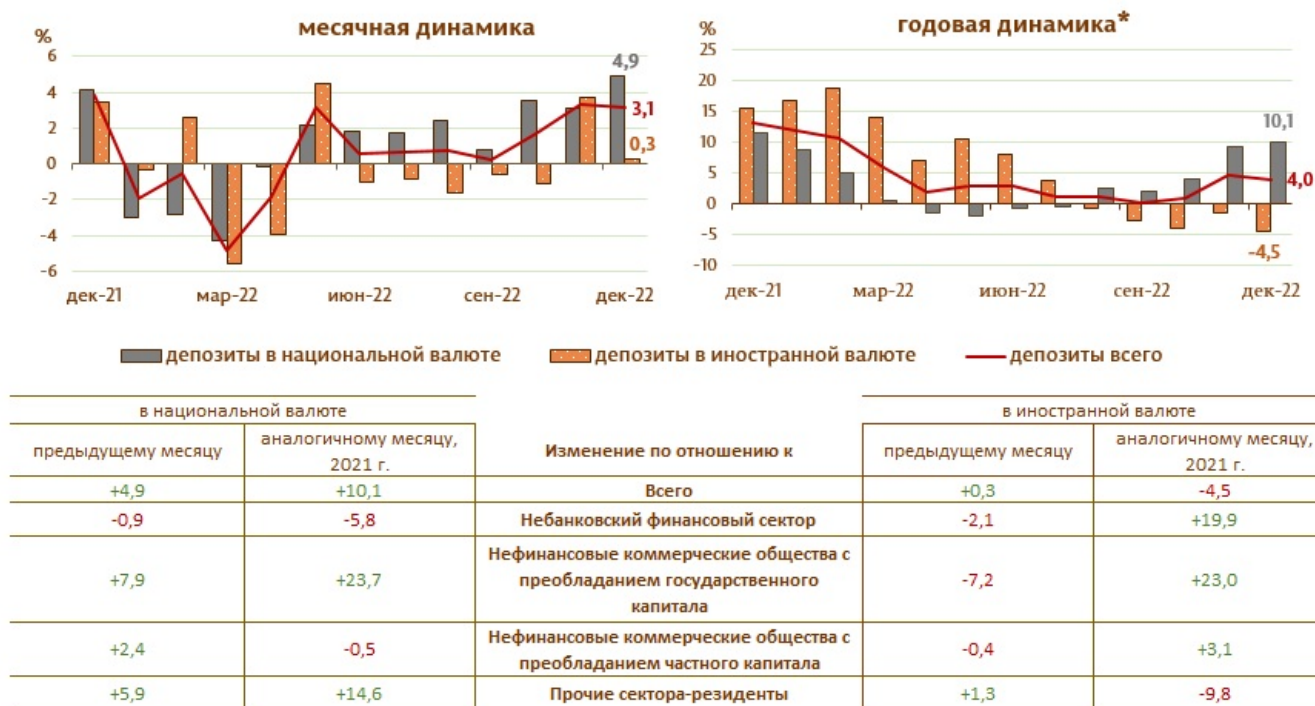
Диаграмма 2. Динамика депозитов 7 , %

* изменение по сравнению с аналогичным периодом прошлого года.