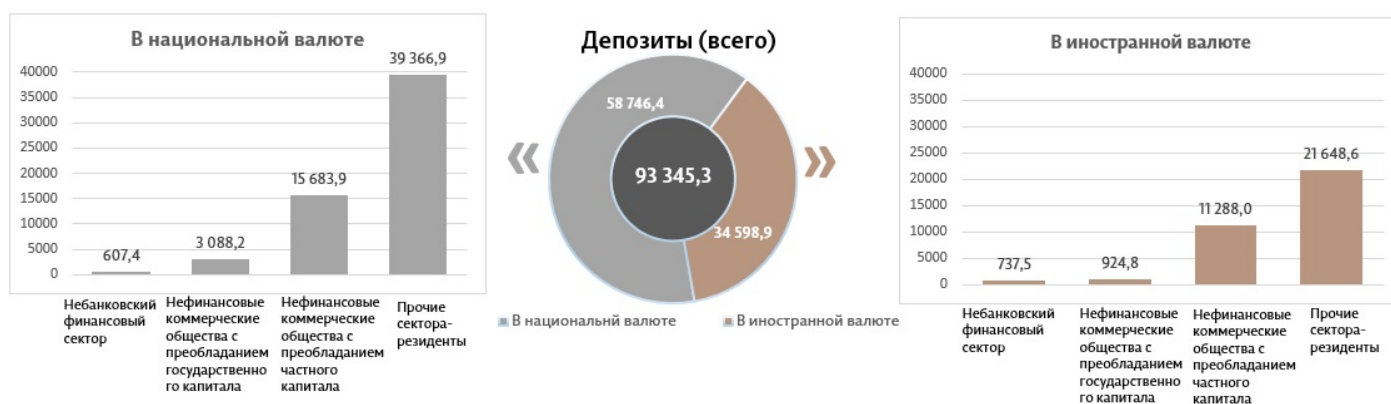
Диаграмма 3. Объем депозитов в январе 2023 7 , млн леев

Сальдо требований к экономике 8 (диаграмма 4) составило 63 240,6 миллиона леев, снизившись в январе 2023 по сравнению с декабрем 2022 на 1 000,1 миллиона леев (1,6%), за счет снижения требований к экономике в национальной валюте на 827,6 миллиона леев (2,0%). В то же время требования к экономике в валюте (пересчитанные в леех) снизились на 172,4 миллиона леев (0,8%).