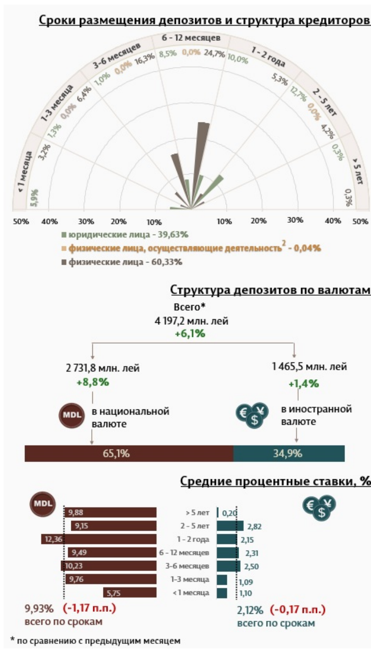
Инфографика 1. Динамика вновь выданных депозитов

Средняя номинальная ставка по новым депозитам, привлеченным в национальной валюте, снизилась на 1,17 процентных пункта по сравнению с предыдущим месяцем и составила 9,93%. Средняя номинальная ставка по депозитам в иностранной валюте снизилась на 0,17 процентных пункта, составив 2,12%.