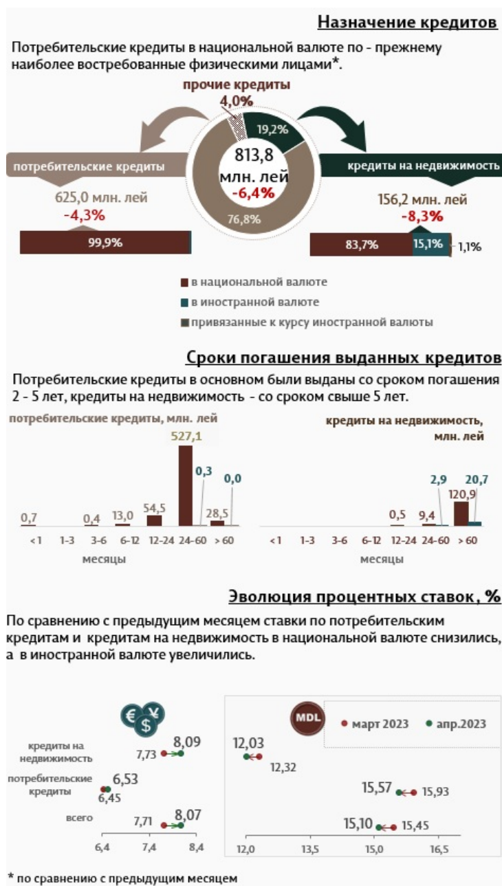
Инфографика 2. Вновь выданные кредиты физическим лицам

Кредиты на недвижимость составляют 19,2% от всех кредитов, выданных физическим лицам, и были предоставлены в основном в национальной валюте (83,7% от общего объема кредитов на недвижимость).