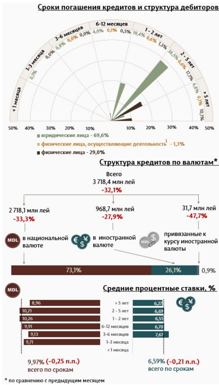
Инфографика 1. Динамика вновь выданных кредитов 2

С точки зрения сроков выданных кредитов, самыми привлекательными были кредиты, выданные на срок от 2 до 5 лет с долей 56,2% от общего объема выданных кредитов. Объем данных кредитов, выданных юридическим лицам, составил 38,5% от общего объема кредитов.