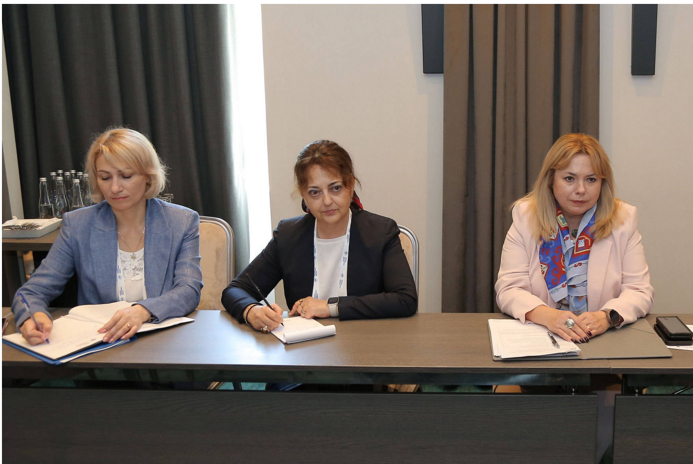
Встреча учредителей Международного валютного фонда и Всемирного банка в Кишиневе: