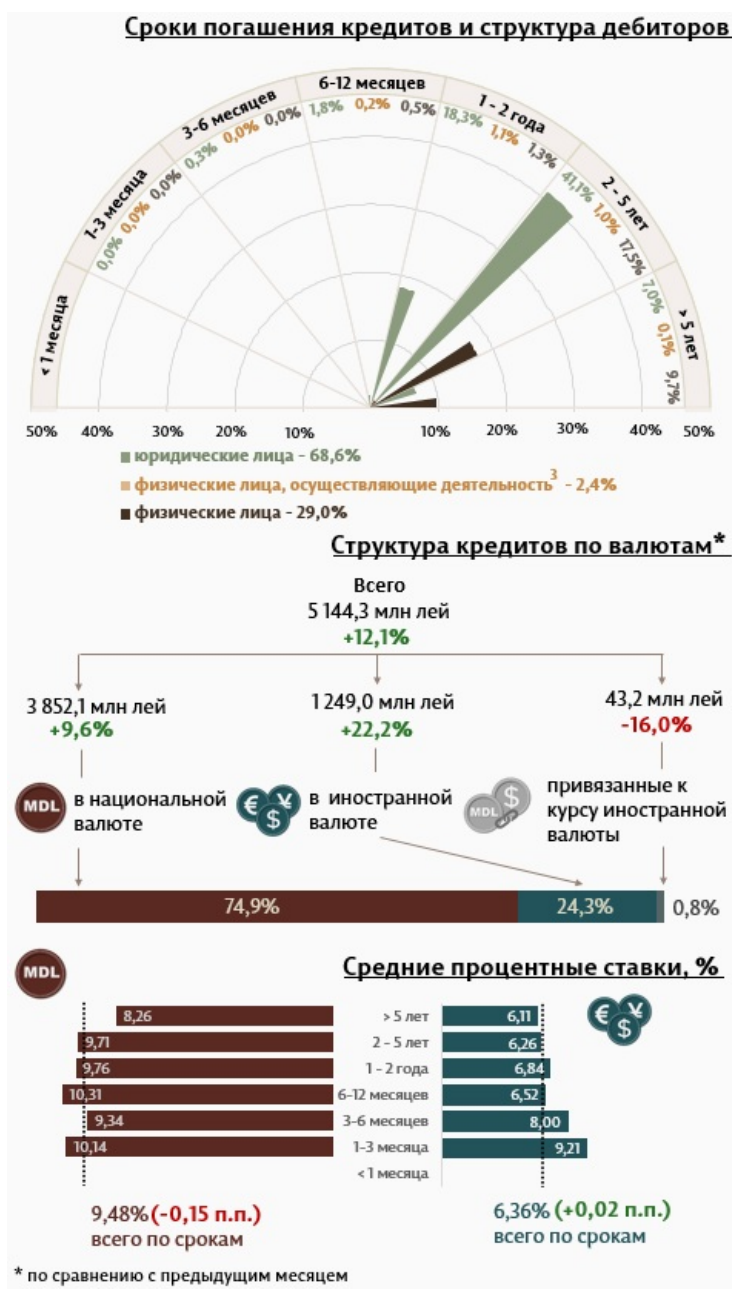
Инфографика 1. Динамика вновь выданных кредитов 2

С точки зрения сроков выданных кредитов, самыми привлекательными были кредиты, выданные на срок от 2 до 5 лет с долей 59,6% от общего объема выданных кредитов. Объем данных кредитов, выданных юридическим лицам, составил 41,1% от общего объема кредитов.