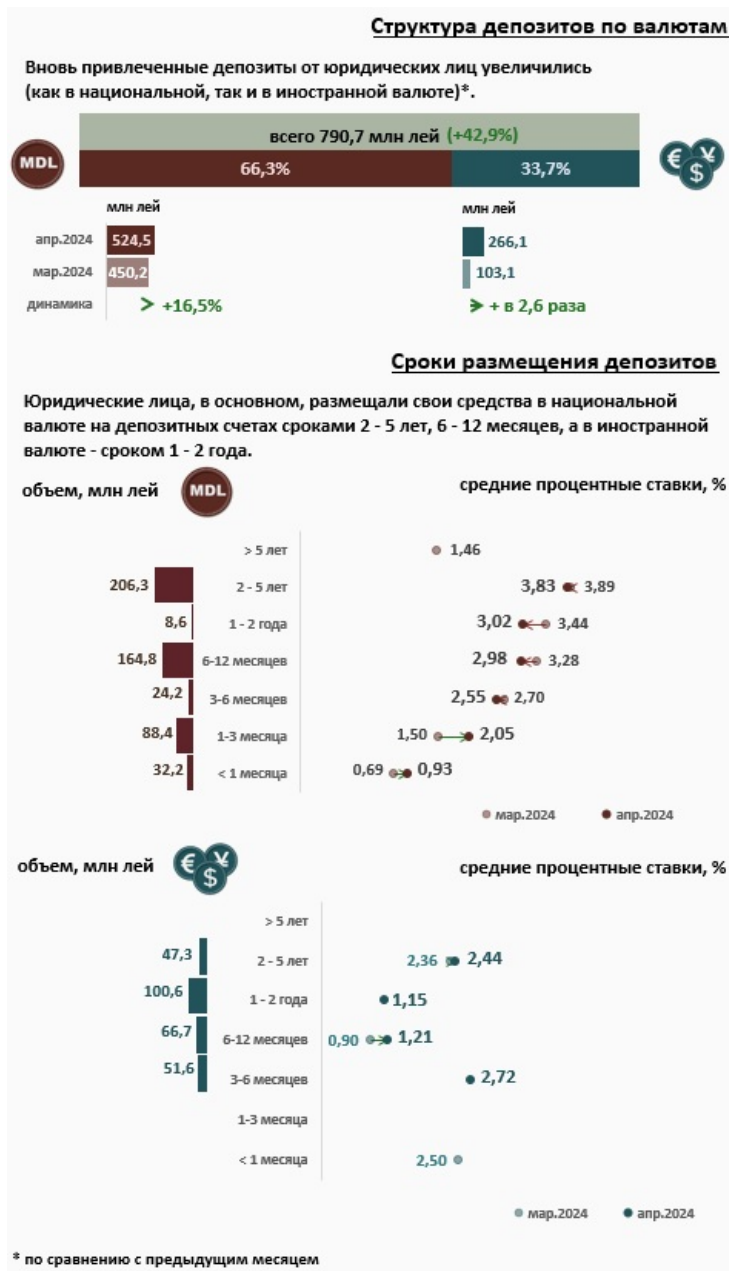
Инфографика 3. Вновь привлеченные срочные депозиты от юридических лиц