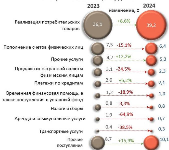
Основные источники денежных поступлений, совокупно за январь - май 2024 г., млрд леев