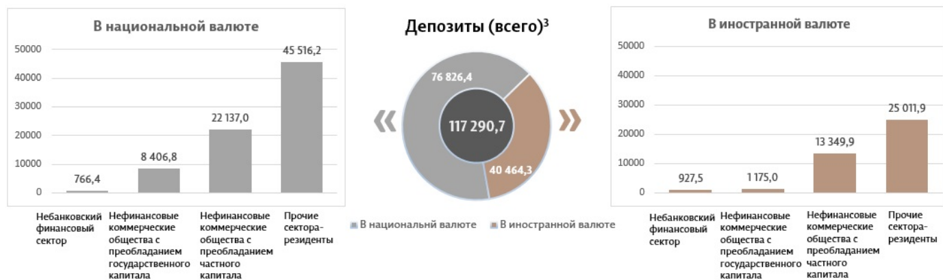
Диаграмма 3. Объем депозитов в мае 2024 г. 7 , миллионы леев

Сальдо депозитов в национальной валюте увеличилось на 876,8 миллиона леев по сравнению с предыдущим месяцем до уровня в 76 826,4 миллиона леев, составив 65,5% от общего сальдо депозитов. В то же время сальдо депозитов в иностранной валюте (пересчитанное в леях) увеличилось на 399,9 миллиона леев по сравнению с предыдущим месяцем, до уровня 40 464,3 миллиона леев, с долей 34,5% (диаграмма 3).