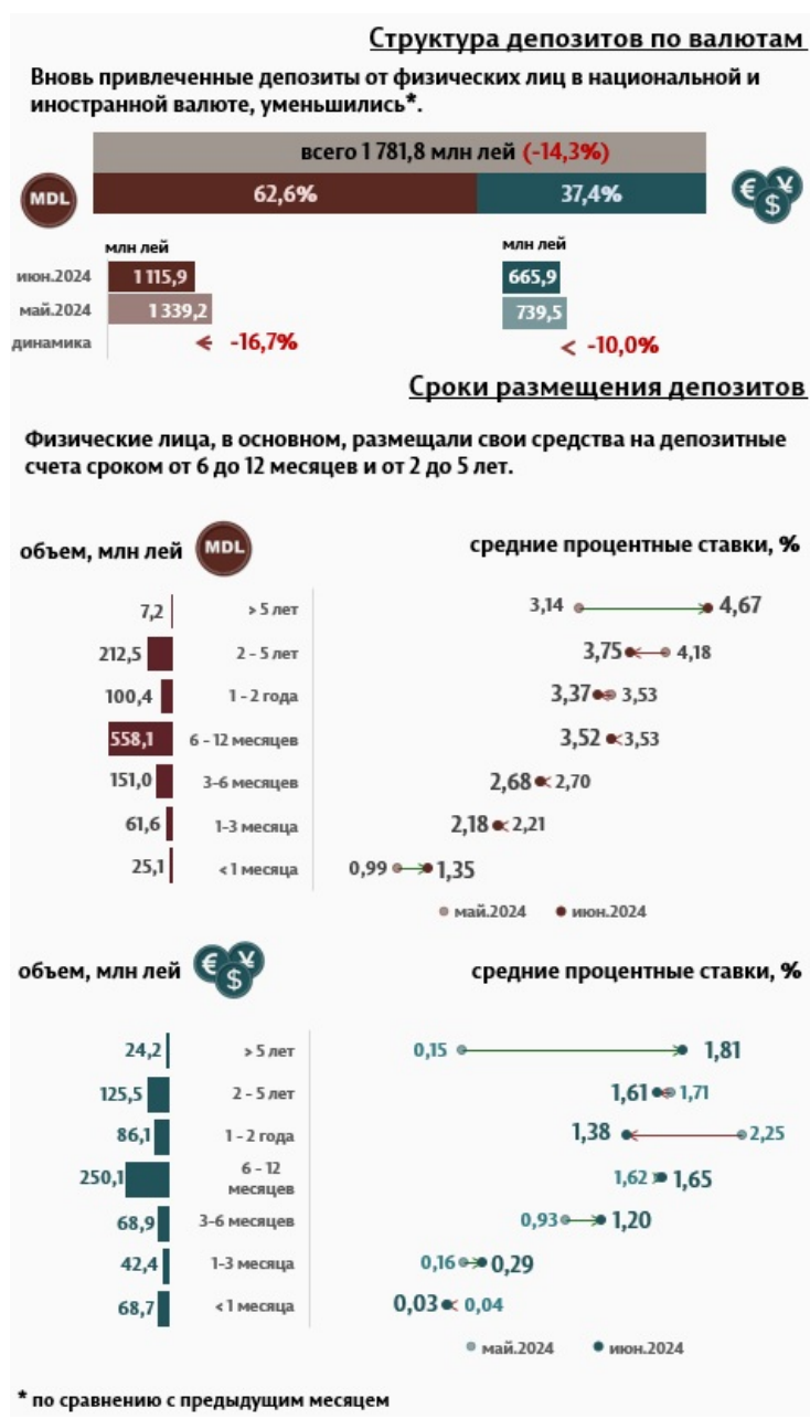
Инфографика 2. Вновь привлеченные срочные депозиты от физических лиц

В отчетном месяце депозиты физических лиц составили 1 781,8 миллиона леев, уменьшившись на 14,3% по сравнению с предыдущим месяцем (Инфографика 2). Наиболее востребованными были депозиты со сроком от 6 до 12 месяцев, доля которых составила 45,4% от общего объема депозитов физических лиц.