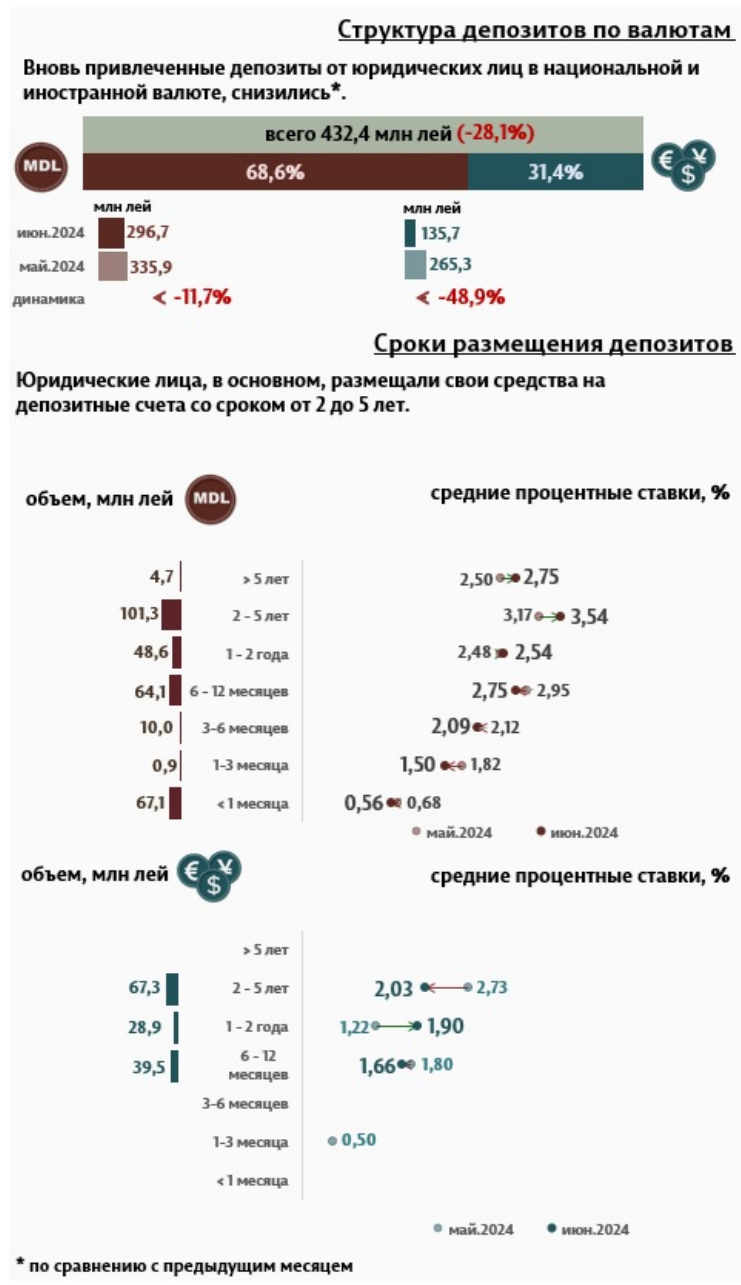
Инфографика 3. Вновь привлеченные срочные депозиты от юридических лиц

Средняя ставка по депозитам, привлеченным от юридических лиц в национальной валюте, снизилась на 0,23 п. п., до уровня 2,46%. В то же время средняя ставка по депозитам, привлеченным в иностранной валюте, увеличилась на 0,21 п. п. и составила 1,89%.