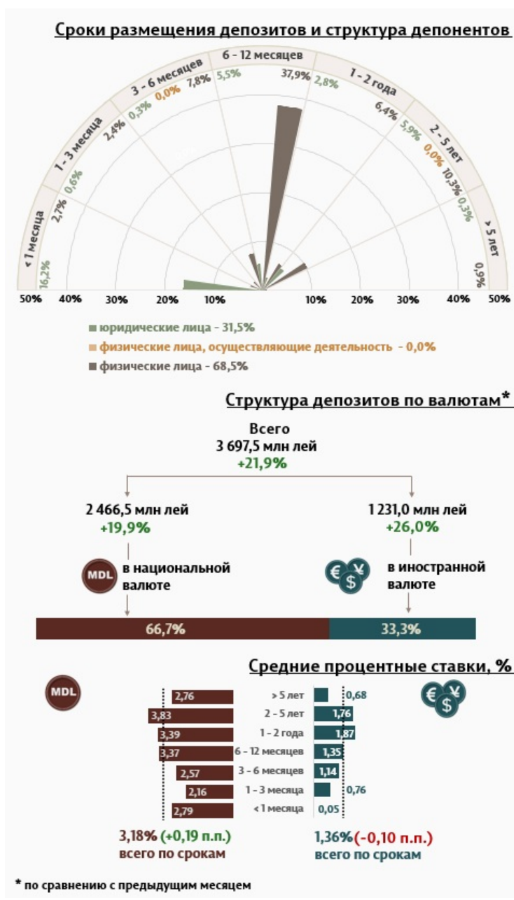
Инфографика 1. Динамика вновь привлечённых депозитов

В августе 2024 г. вновь привлечённые срочные депозиты 1 (Инфографика 1) составили 3 697,5 миллиона леев, увеличившись на 21,9% по сравнению с июлем 2024 года. Привлечённые депозиты в национальной валюте составили наибольшую долю в 66,7% или 2 466,5 миллиона леев, что на 19,9% больше по сравнению с предыдущим месяцем. Депозиты, привлечённые в иностранной валюте, составили 1 231,0 миллиона леев, увеличившись на 26,0% по сравнению с предыдущим месяцем.