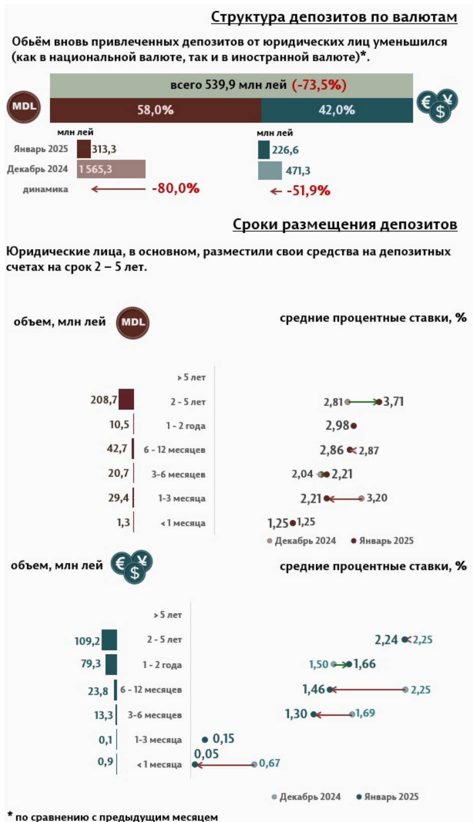
Инфографика 3. Вновь привлечённые срочные депозиты от юридических лиц

В январе 2025 г., по сравнению с предыдущим месяцем, объём депозитов юридических лиц в национальной валюте существенно уменьшился на 80%, а в иностранной валюте на 51,9% (Инфографика 3). Депозиты юридических лиц в национальной валюте составили 313,3 миллиона леев, а в иностранной валюте – 226,6 миллиона леев. По сравнению с январём 2024 г., объём депозитов юридических лиц в национальной валюте уменьшился на 60,7%, а в иностранной валюте увеличился на 30,1%.