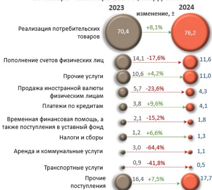
Основные источники денежных поступлений, совокупно за январь - сентябрь 2024 г., млрд леев