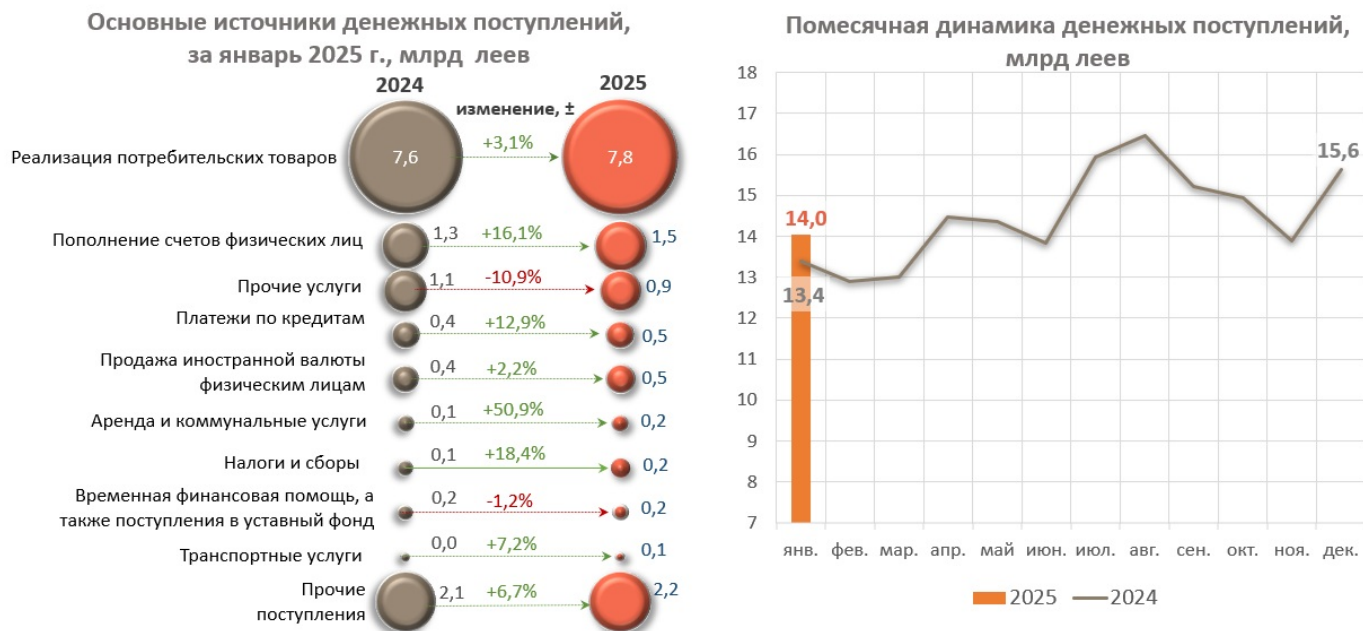
Диаграмма пг. 1. Основные источники поступления денежной наличности в кассах банков и их ежемесячная динамика 3

При этом, значительно сократились поступления от предприятий, предоставляющие другие услуги на 115,8 млн леев (-10,9%).