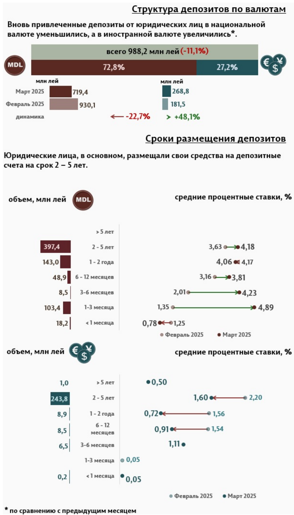
Инфографика 3. Вновь привлечённые срочные депозиты от юридических лиц

В марте 2025 г., по сравнению с предыдущим месяцем, объём депозитов юридических лиц в национальной валюте сократился на 22,7%, а в иностранной валюте увеличился на 48,1% (Инфографика 3). Депозиты юридических лиц в национальной валюте составили 719,4 миллиона леев, а в иностранной валюте – 268,8 миллиона леев. По сравнению с мартом 2024 г., объём депозитов юридических лиц в национальной валюте увеличился на 59,8%, а в иностранной валюте увеличился в 2,6 раза.