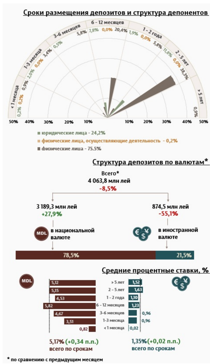
Инфографика 1. Динамика вновь привлечённых депозитов

В мае 2025 г. вновь привлечённые срочные депозиты 1 (Инфографика 1) составили 4 063,8 миллиона леев, уменьшившись на 8,5% по сравнению с апрелем 2025 года. Привлечённые депозиты в национальной валюте составили наибольшую долю в 78,5% или 3 189,3 миллиона леев, что на 27,9% больше по сравнению с предыдущим месяцем. Депозиты, привлечённые в иностранной валюте, составили 874,5 миллиона леев, уменьшившись на 55,1% по сравнению с предыдущим месяцем.