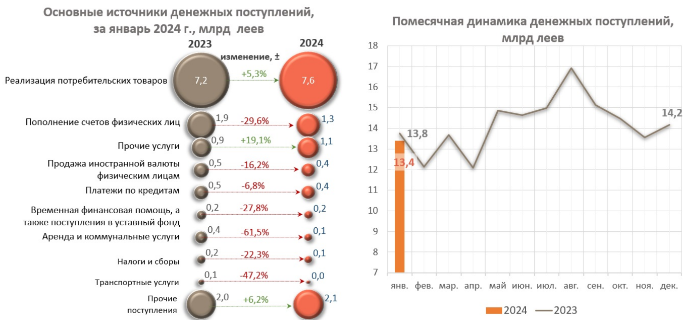
Диаграмма nr. 1. Основные источники денежных поступлений в кассах банков и их ежемесячная динамика

В то же время зафиксировано существенное увеличение поступлений от реализации потребительских товаров (независимо от канала их реализации) на 383,4 млн леев (+5,3%). Также увеличились поступления от предприятий, предоставляющих прочие услуги на 170,4 млн леев (+19,1%), и прочие поступления на 120,9 млн леев (+6,2%).