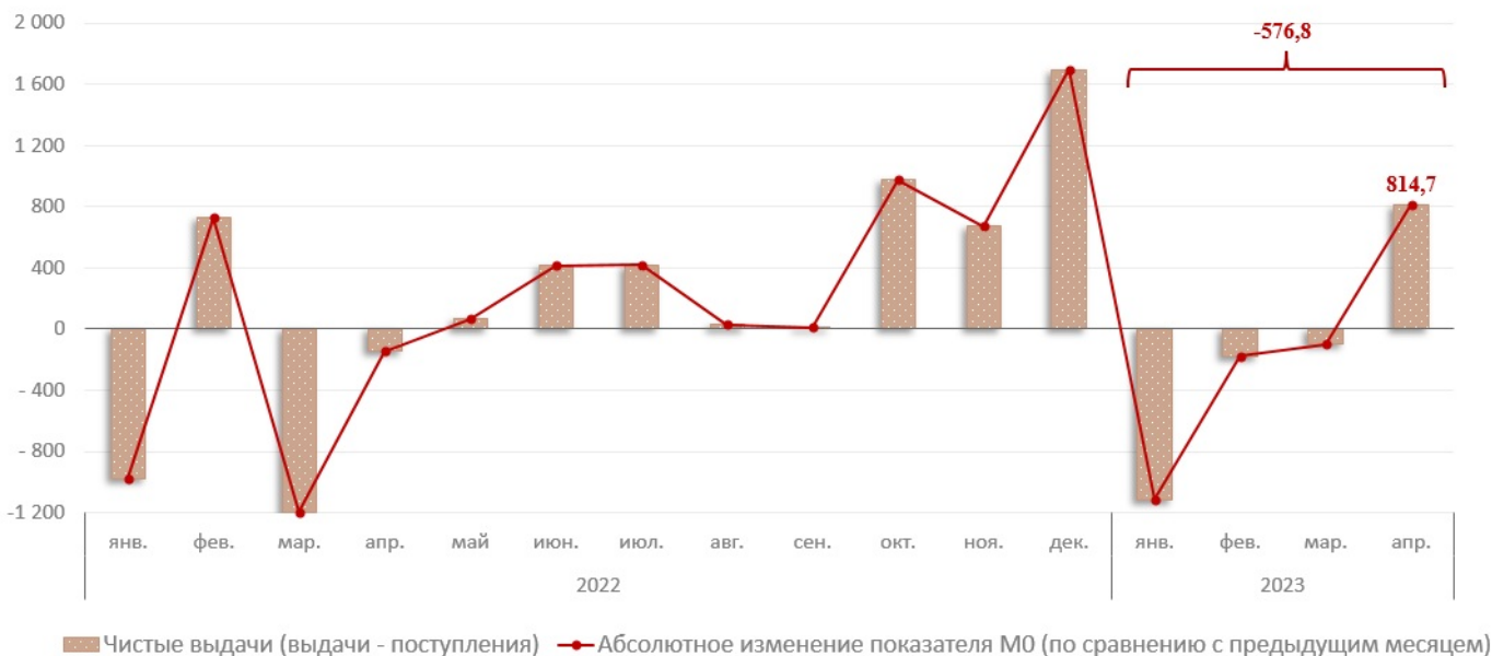
Диаграмма № 1. Взаимосвязь показателя M0 с объемом кассовых операций, млн леев

В апреле 2023 г. денежная масса M0^1 (деньги в обращении) составила 33 829,2 млн леев, снизившись на 576,8 млн леев (-1,7%) по сравнению с декабрем 2022 г. (диаграмма №1) в результате снижения в январе – апреле 2023 объема совокупных выдач над объемом совокупных поступлений в банковскую систему 2 на 576,7 млн леев.