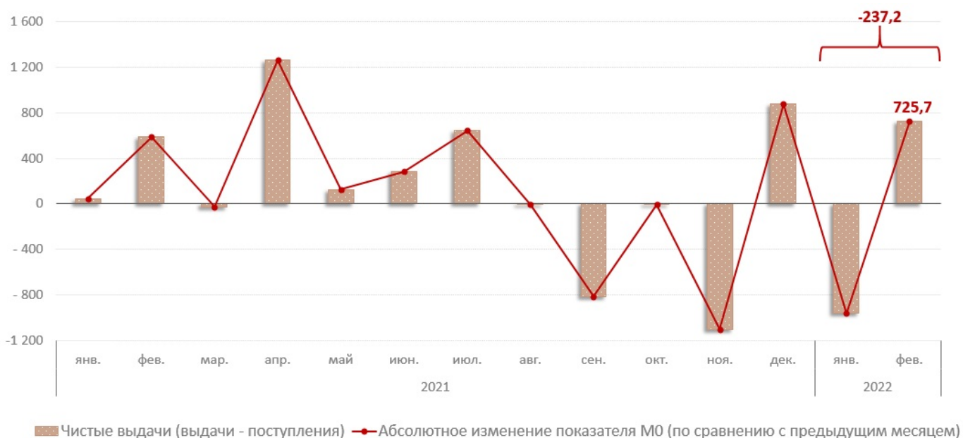
Диаграмма № 1. Взаимосвязь показателя M0 с объемом кассовых операций по банковской системе, млн. леев

В январе - феврале 2022 г., объем денежных поступлений увеличился на 23,2% по сравнению с аналогичным периодом прошлого года и составил 24 288,8 млн. леев. Увеличение объема поступлений наличных денежных средств обусловлено, в основном, увеличением на 14,7% поступлений от реализации потребительских товаров (независимо от каналов их реализации), которые имеют наибольшую долю (50,8%) в совокупном объеме поступлений. (Диаграмма № 2). Следует отметить, что данная эволюция была подкреплена увеличением практически всех источников денежных поступлений.