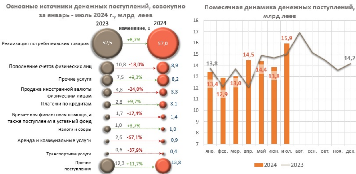
Диаграмма nr. 1. Основные источники поступления денежной наличности в кассах банков и их ежемесячная динамика 4

При этом, в январе – июле 2024 г. значительно сократились поступления наличных денежных средств на текущие и депозитные счета физических лиц на 1 950,8 млн леев (-18,0%), поступления от аренды и коммунальных услуг на 1 745,7 млн леев (-67,1%), а также уменьшилось поступление наличности от продажи иностранной валюты физическим лицам на 1 033,6 млн леев (-24,0%), составив 3 271,7 млн леев (эквивалент 184,2 млн долларов США 3 ).