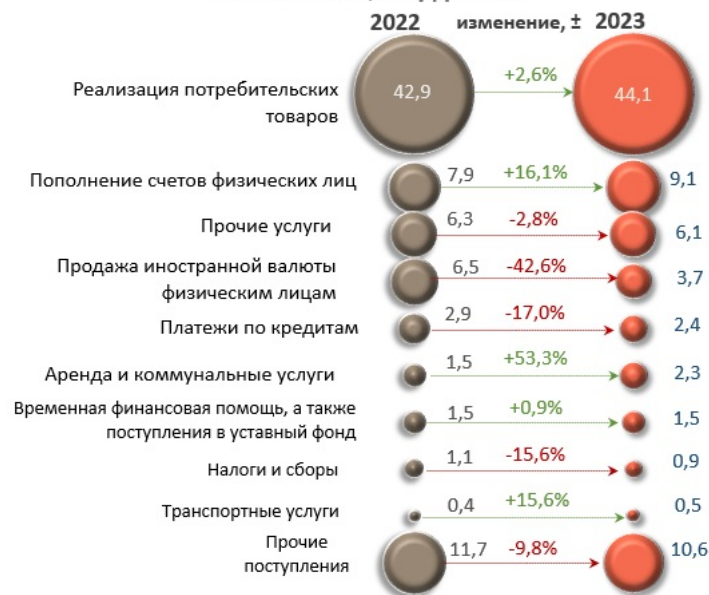
Основные источники денежных поступлений, за январь – июнь 2023 г., млрд леев