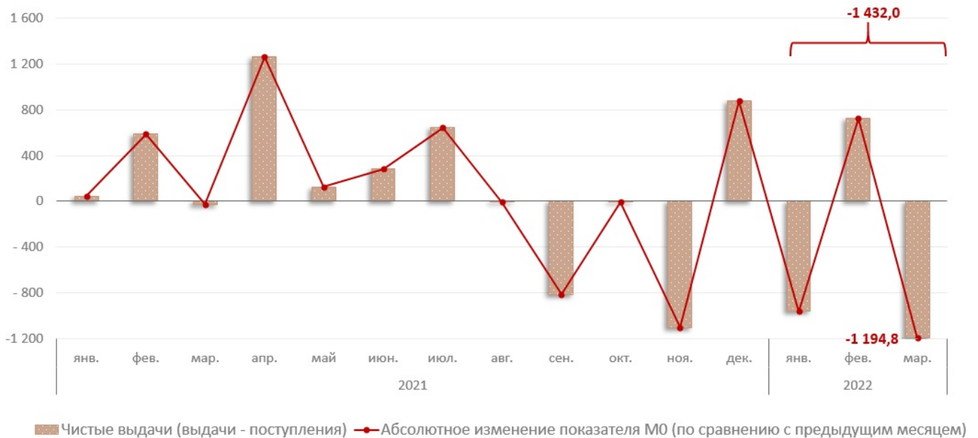
Взаимосвязь показателя M0 с объемом кассовых операций, млн. леев

В январе - марте 2022 г., объем денежных поступлений увеличился на 26,1% по сравнению с аналогичным периодом прошлого года и составил 39 816,9 млн. леев. Увеличение объема поступлений наличных денежных средств обусловлено, в основном, увеличением на 13,2% поступлений от реализации потребительских товаров (независимо от каналов их реализации), которые имеют наибольшую долю (49,6%) в совокупном объеме поступлений (Диаграмма № 2). В то же время поступления от продажи иностранной валюты физическим лицам увеличились в 4,0 раза, составив 3 922,6 млн. леев (эквивалент 216,8 млн. долларов США 3 ).